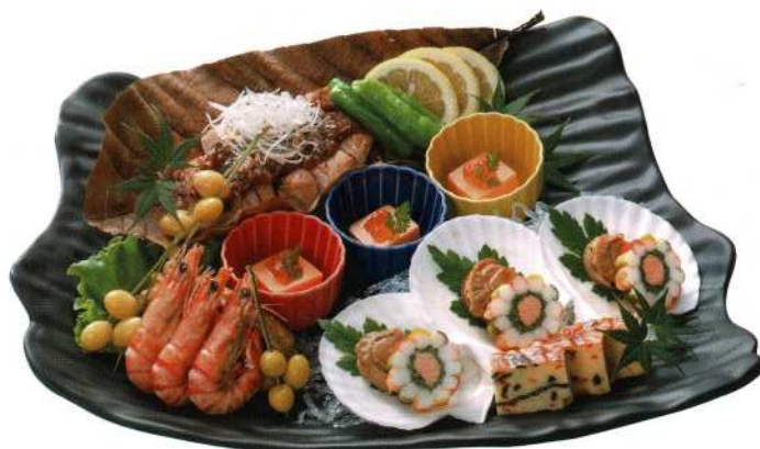
和風オードブル(3名様)