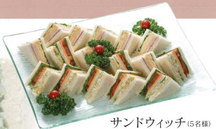
サンドウィッチ (5名様) 5,000円 (税込価格5,500円)