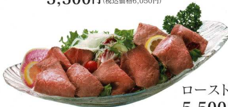
ローストビーフサラダ(3名様)