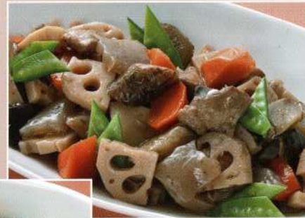
筑前煮 (5名様) 5,500円 (税込価格6,050円)