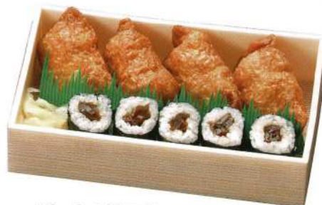
助六寿司 900円 (税込価格990円)