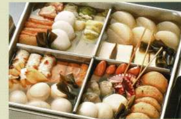
おでん (20名様) 15,000円 (税込価格16,500円)