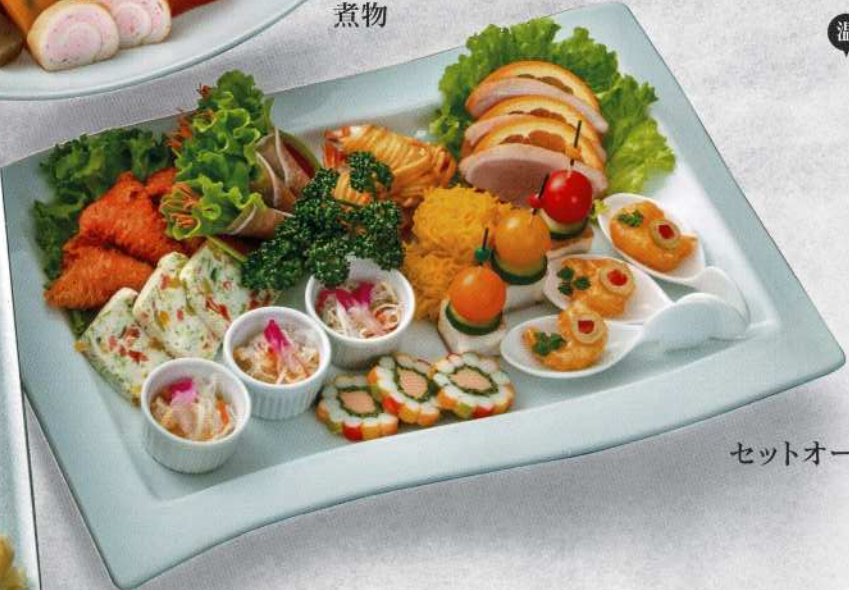
セットオードブル