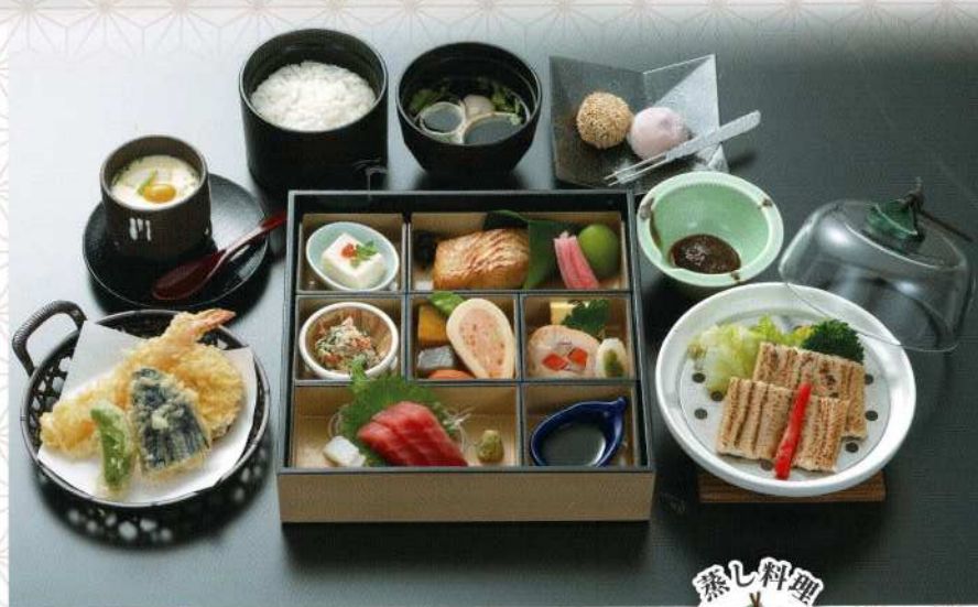
雲仙 5,500円 (税込価格6,050円)