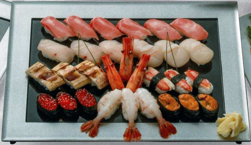
特選寿司盛合せ (3名様) 3台