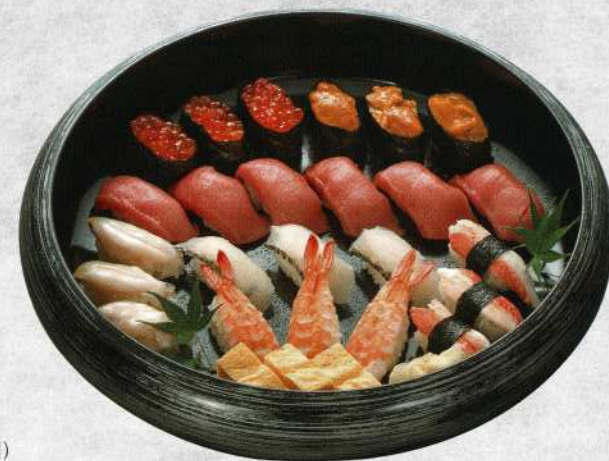
②特上寿司盛合せ (3名様) 12,000円 (税込価格13,200円)