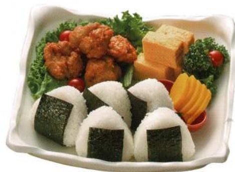
おにぎりセット (鮭のみ) (5名様) 1,700円 (税込価格1,870円) おにぎり単品 230円 (税込価格253円)