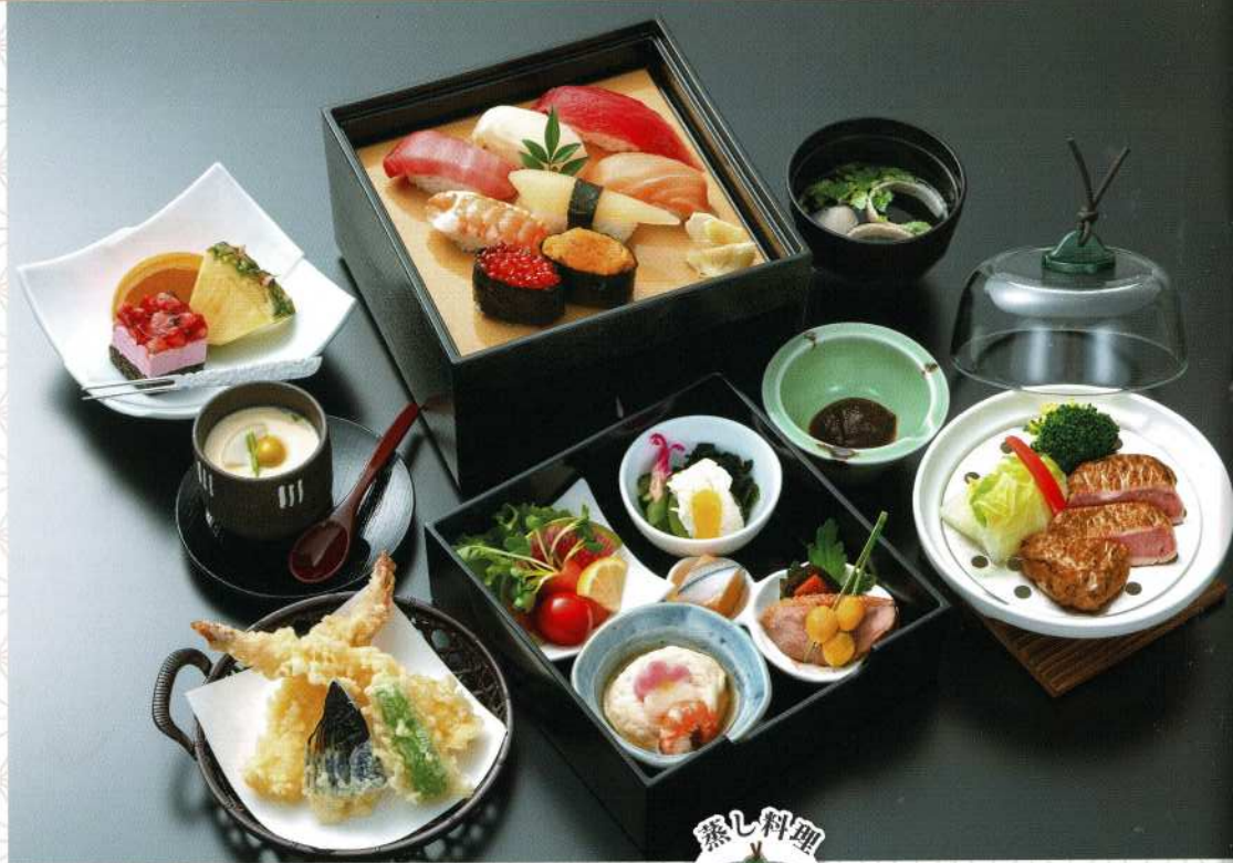
有馬 8,500円 (税込価格9,350円)