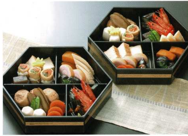
煮物 (5名様) 6,500円 (税込価格7,150円)