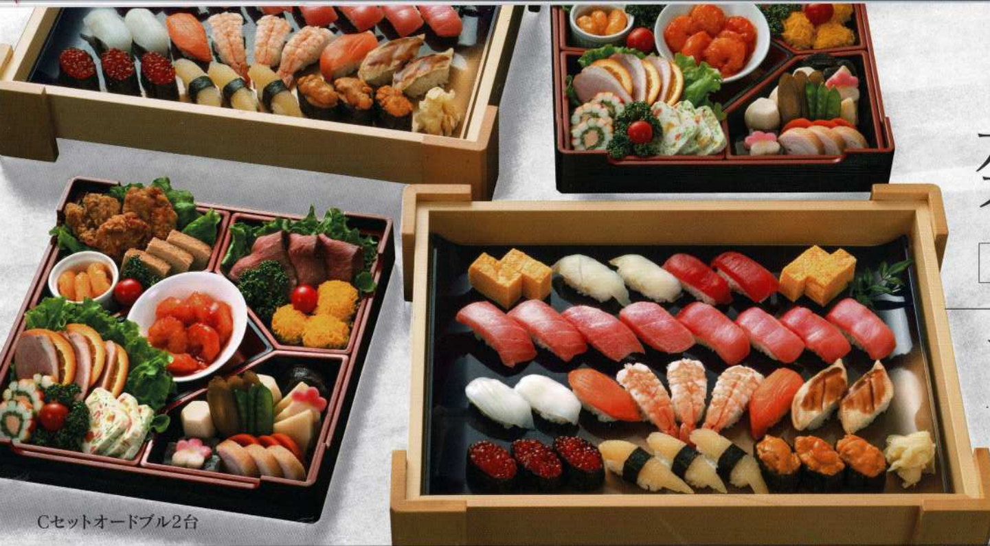
Cセットオードブル2台