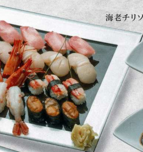
海老チリソース 温