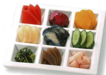
お新香盛合せ 2,200円 (税込価格2,420円)