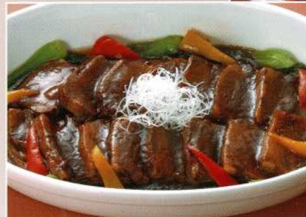
豚の角煮 (5名様) 7,000円 (税込価格7,700円)