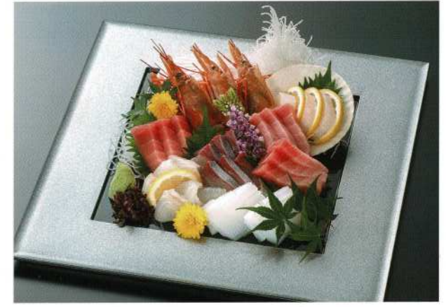
刺身盛合せ (3名様) 7,000円 (税込価格7,700円)