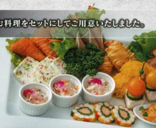
セットオードブル 2台