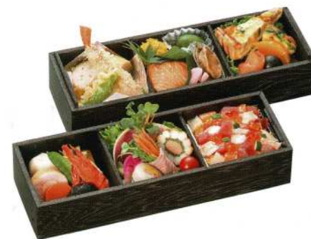
導師様用折詰 B 5,500円 (税込価格6,050円)