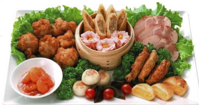
中華オードブル(3名様)