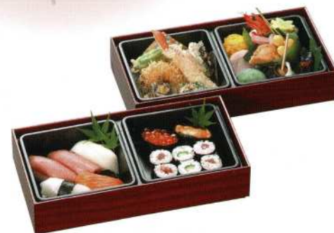
導師様用折詰 A 5,500円 (税込価格6,050円)

御用途限定品の為、用途や数量によっては ご注文を承れない場合もございます。 ご了承いただけますようお願い申し上げます。