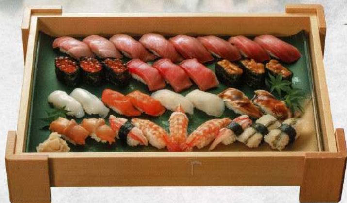
上寿司盛合せ (4~5名様) 16,000円 (税込価格17,600円)