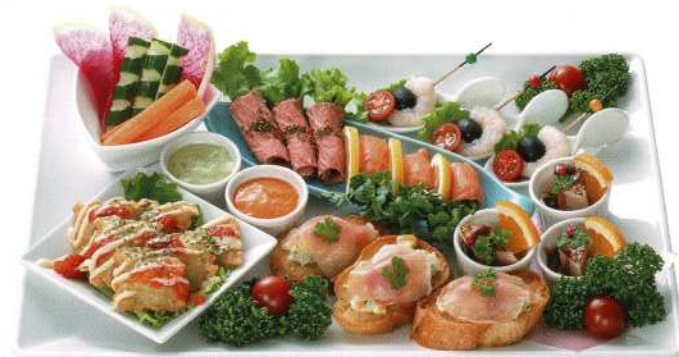
洋風オードブル(3名様)