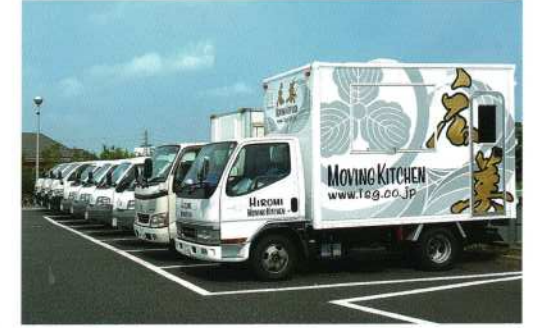
安全にお料理をお届けできますよう、冷蔵車を完備しております。