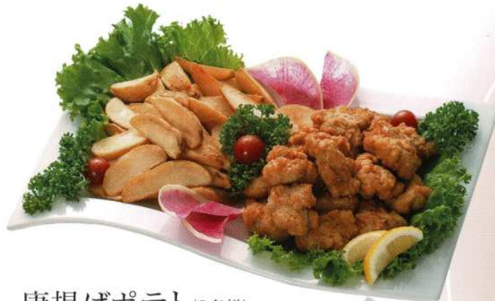
唐揚げポテト (3名様) 4,000円 (税込価格4,400円)