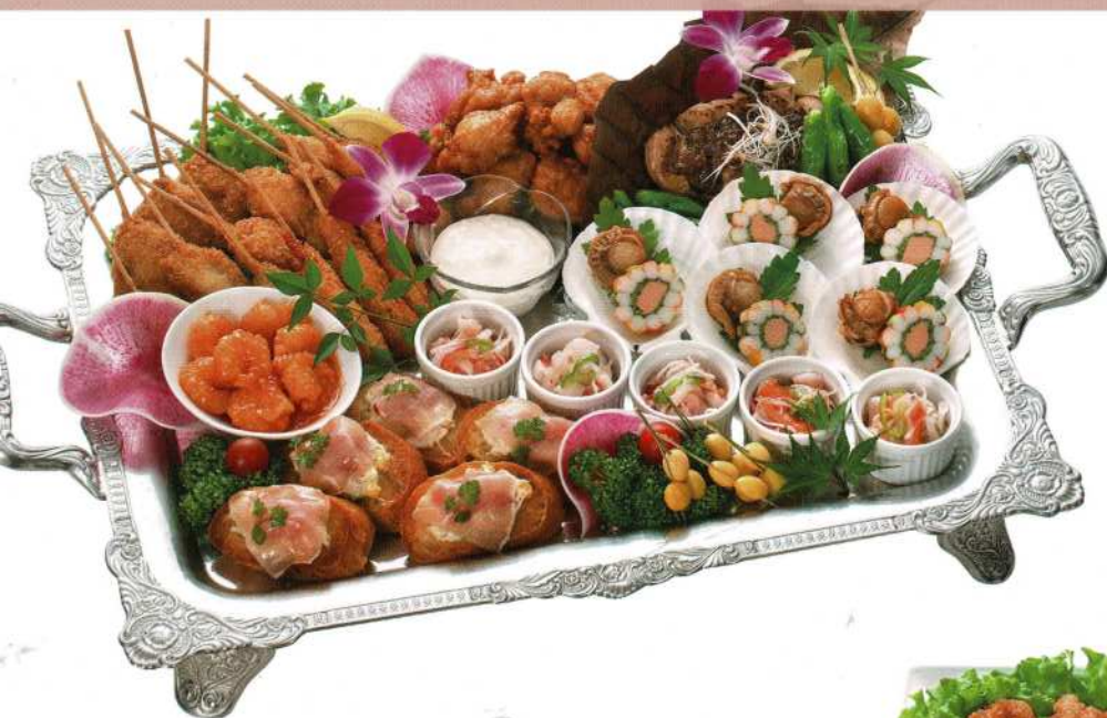
ミックスオードブル