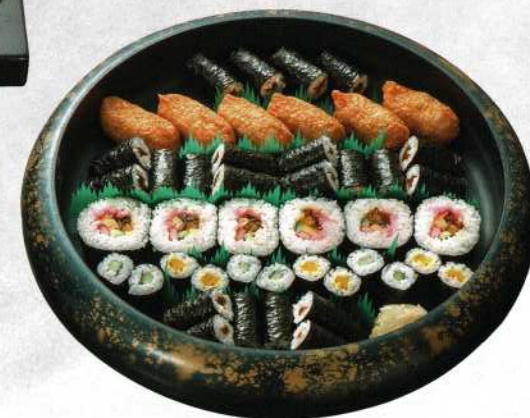
のり巻きいなり (5名様) 5,500円 (税込価格6,050円)

※花や敷物等は商品に含まれておりません。 ※アレルギーをお持ちの方、ワサビ抜きをご希望の方は、事前にご連絡願います。 ※お米はすべて国産米を使用しております。 ※表示価格は全て税込みとなります。