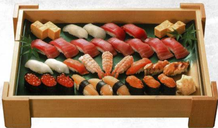
③寿司盛合せ (4~5名様) 13,000円 (税込価格14,300円)