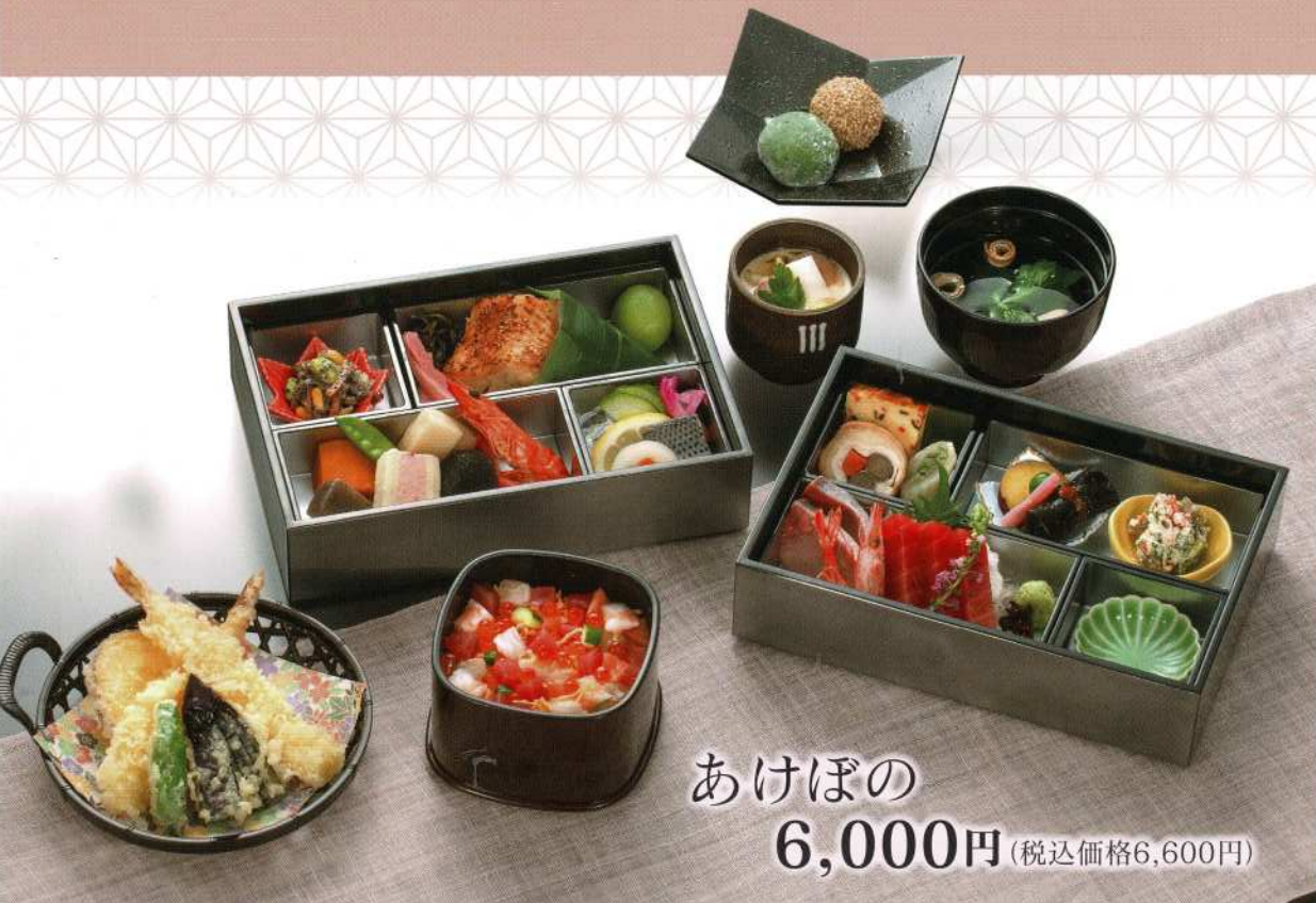
あけぼの 6,000円 (税込価格6,600円)