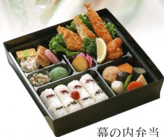
幕の内弁当 3,300円 (税込価格3,630円)