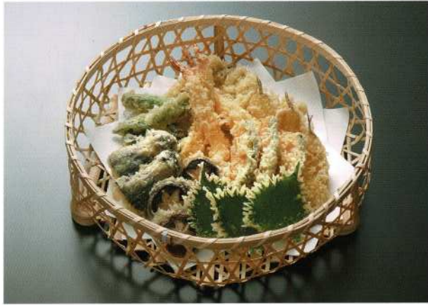
天ぷら (3名様) 5,500円 (税込価格6,050円)