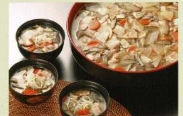
豚汁 (30名様) 9,000円 (税込価格9,900円)