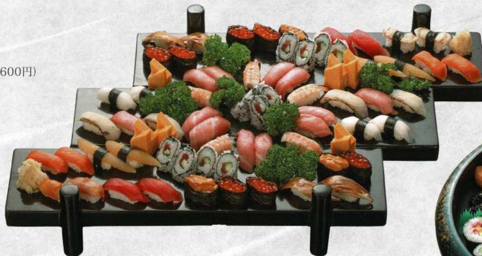
④寿司盛合せ (8~10名様) 25,000円 (税込価格27,500円)