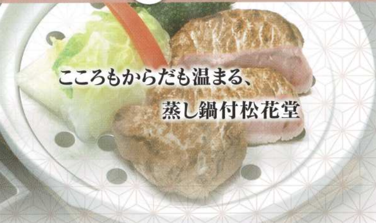
こころもからだも温まる、 蒸し鍋付松花堂