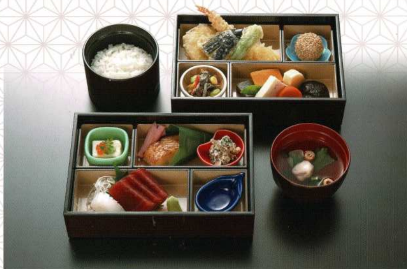
せせらぎ 4,000円 (税込価格4,400円)