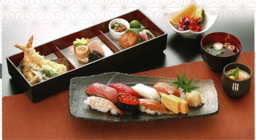
もみじ 5,500円 (税込価格6,050円)