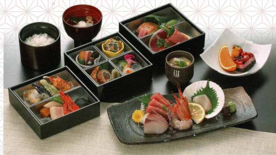
うらら 7,000円 (税込価格7,700円)