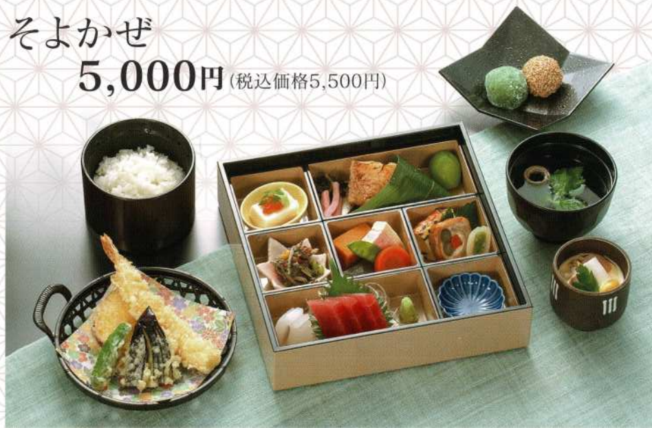
そよかぜ 5,000円 (税込価格5,500円)

※保健所の指導により、折詰以外のお料理の持ち帰りはお断りしております。 ※季節・仕入れの状況により、お料理の内容や器が変わる場合がございます。