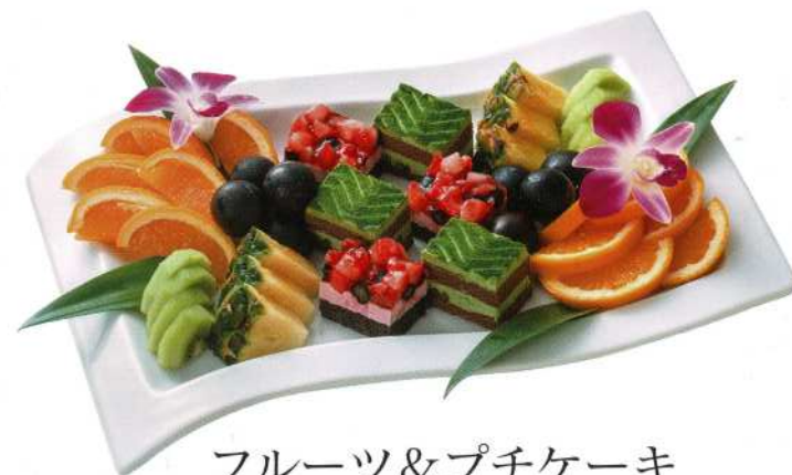
フルーツ&プチケーキ